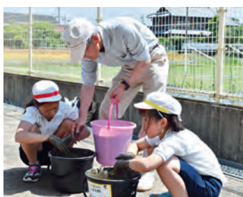
池田町立温知小学校