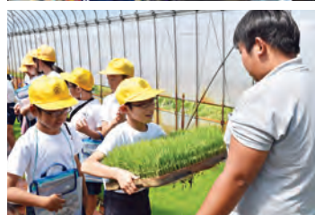
大野町立西小学校の児童は6月5日に同町野地区のハウスを見学しました。

た。児童らは、当JA職員から品質の良い水稻苗を作るためにはハウスの温度や水の管理が大切だと学びました。