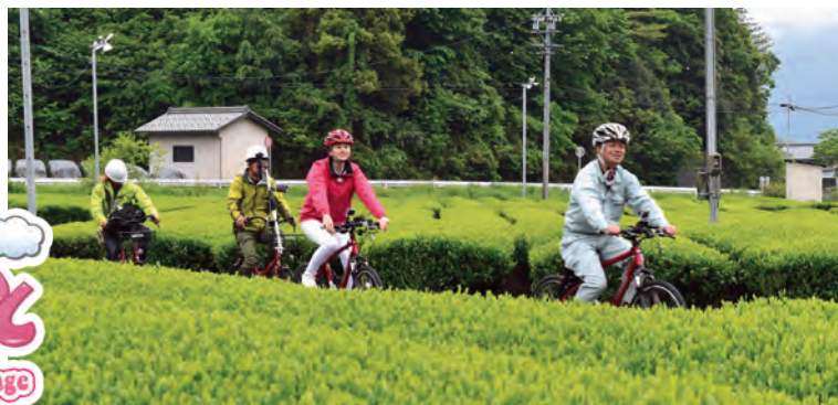
サイクリングを楽しみながら、揖斐郡内の茶畑を巡りました。

今月の放送はJAいび川編です。番組の内容を写真で少しだけご紹介します。また、番組内でプレゼントコーナーがありますのでご家族お揃いでぜひご覧ください。