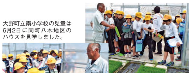
大野町立南小学校の児童は6月2日に同町八木地区のハウスを見学しました。

大野町立中小学校、同町立南小学校、同町立西小学校の児童は、水稻苗を育てる育苗ハウスを見学しました。児童らは、