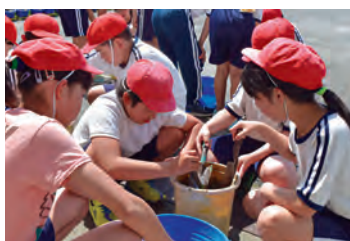
組合立養基小学校