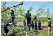
揖東中学校生徒が体験