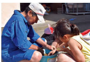
揖斐川町立清水小学校

揖斐川町立清水小学校、組合立養基小学校、池田町立温知小学校の5年生児童は、バケツを使って手軽に稲作を体験できるバケツ稲作に取り組みを始めました。