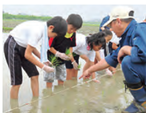
大野町立中小学校の児童は5月26日に同校近くの水田で田植えを行いました。

郡内の小学校5年生児童はお米を作る過程を体験し、農業の大切さなどを学んでいます。児童らは水田に入り、田植えを体験。手で植える苦勞を体験した後、正確に苗を素早く植えていく機械植えを見学しました。