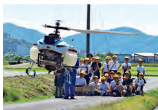
揖斐川町立大和小学校の児童は5月19日に青年部指導のもと、田植えと防除ヘリの見学をしました。