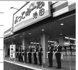
よってみーな池田