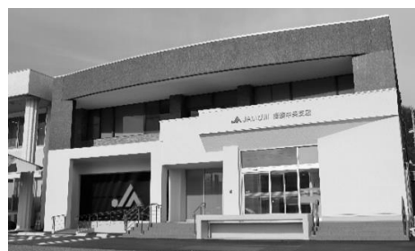
令和5年3月 揖斐中央支店