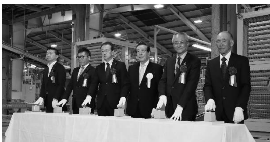
令和4年5月 大野果実共同選果場竣工